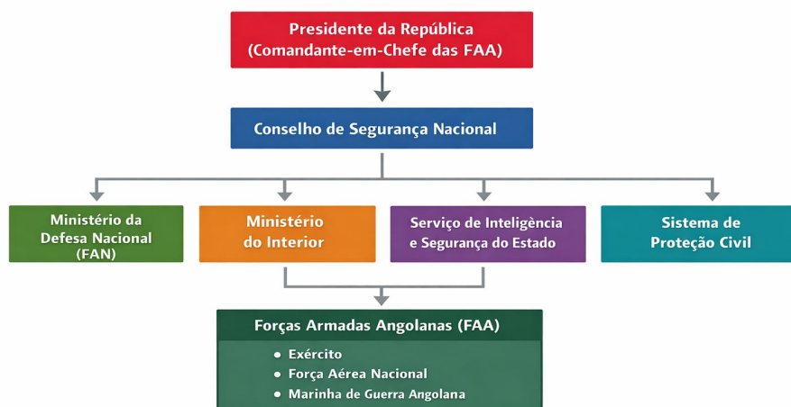
Figura 1 – Estrutura do Sistema de Segurança e Defesa Nacional de Angola